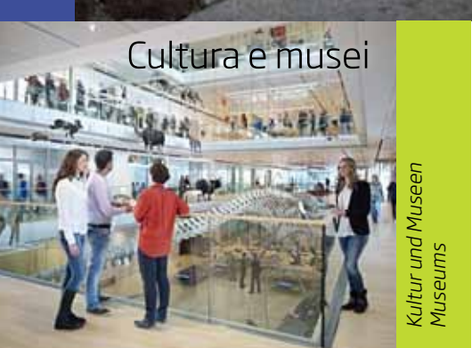
Cultura e musei