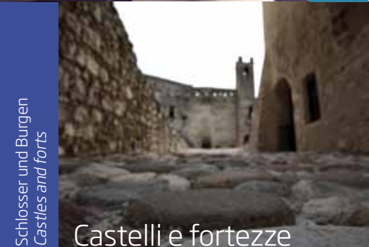
Castelli e fortezze