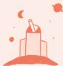
Osservatorio astronomico di Monte Lugna