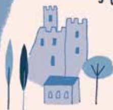
Castello di Avio