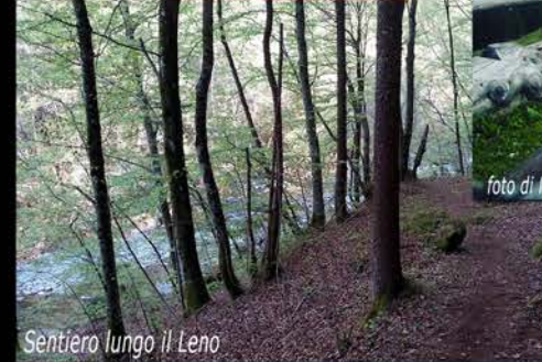
Sentiero lungo il Leno