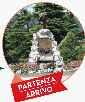
PARTENZA ARRIVO PUNTO ALPINO

L'iscrizione, ad offerta libera, prevede un gadget a ricordo della manifestazione che sarà consegnato al termine della marcia.