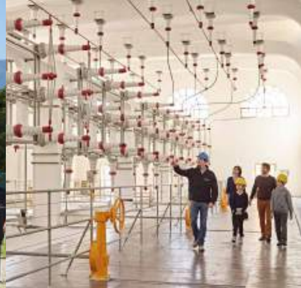
Riva del Garda